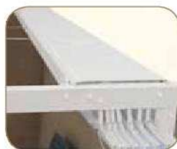
Option auvent en PVC 502